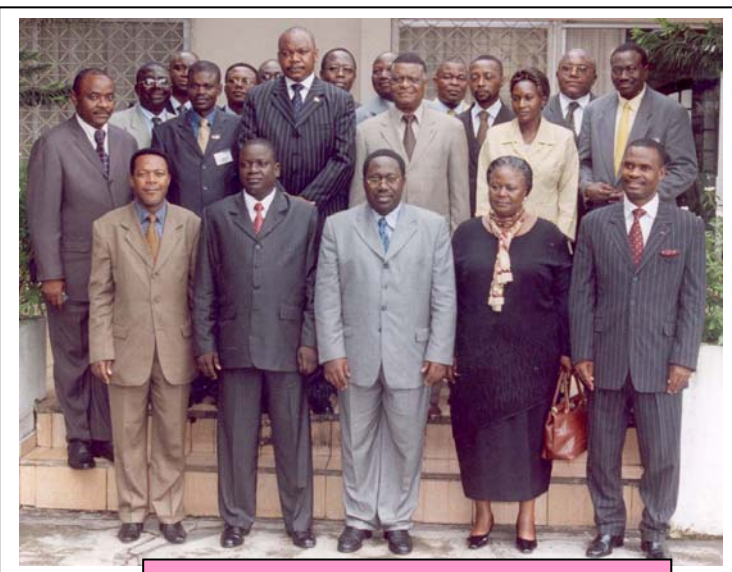
Les MINAGRI/CEMAC à Douala

Le 9 septembre 2005 à Douala, Cameroun, les Ministres en charge des problèmes agricoles des pays membres de la CEMAC (Communauté Economique et Monétaire de l'Afrique Centrale) ont signé le document de la réglementation commune sur l'homologation des pesticides en zone CEMAC. Cette volonté politique ainsi manifestée par les gouvernements de cette sous région, donne la possibilité aux experts, encadrés par le CPI et la CEMAC et réunis au sein d'une Cellule de suivi, d'accélérer le processus de mise en place du Comité d'homologation des Pesticides en Afrique Centrale (CPAC), tel que prévu dans la réglementation signée par les MINAGRI/CEMAC. Ci-dessous le compte rendu de la réunion des experts qui s'est tenu en prélude à la signature du document de la réglementation.